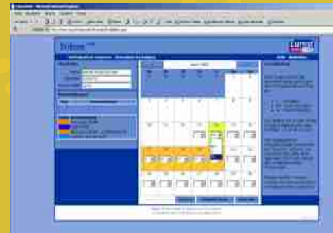
Planungskomfort mit Web-Interface

Das geschützte Web-Interface von TriTOM macht es flexibel arbeitenden Mitarbeiter/innen leicht, Bedarfspläne einzusehen und Einsatzwünsche zu übermitteln.