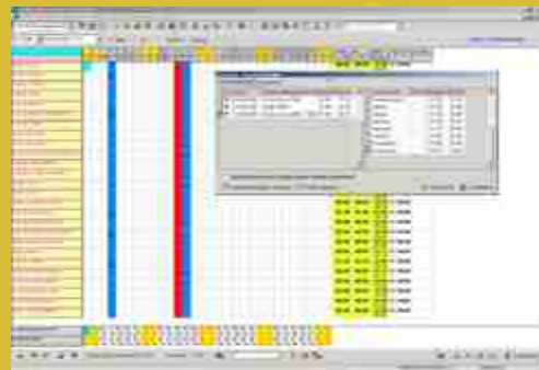
Dienstplan- und Personalmanagement mit Dienstplaneingabe

TriTOM ist ein Personal- und Umsatzdatenmanagementsystem, das mit differenzierten Planungs- und Analyse-Fähigkeiten glänzt und Ihre Steuerungs- und Abrechnungsaufgaben deutlich vereinfacht. Sie profitieren von einem konsistenten Datenbestand und ersparen sich den Aufwand für Doppelerfassungen. TriTOM kommuniziert dank flexibler Schnittstellen mit Ihren bereits vorhandenen Daten und anderer Branchensoftware.